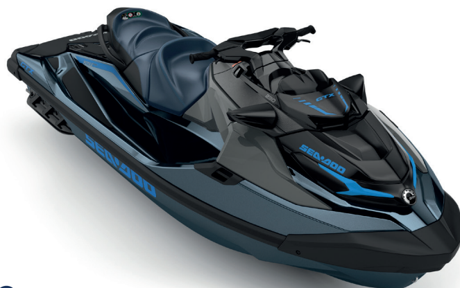
Blue Abyss / Gulfstream Blue