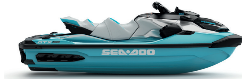
● Teal Metallic