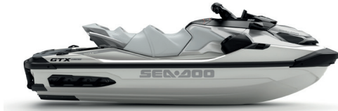
○ White Pearl Premium